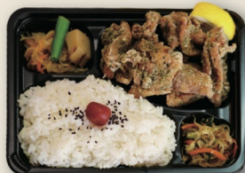
のり塩からあげ弁当 (からあげ6個入) ¥910