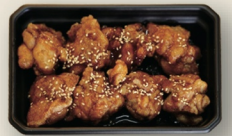
とりの黒酢からあげ [8個入] ¥800