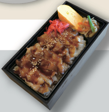
炭焼き弁当 ¥1,100 炭焼き弁当 肉大盛 ¥1,300