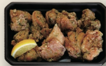
のり塩からあげ [8個入] ¥800