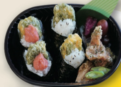
天たまむすび弁当 ¥750 * ご飯大盛りできません