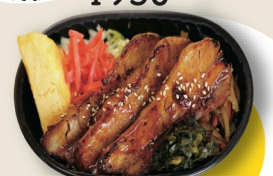
豚かば焼きわっぱ弁当 ¥950