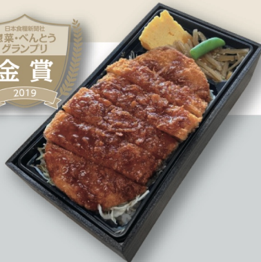
黒酢ソースかつ重 ¥1,100