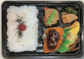
* 日替わり写真はイメージです 数量限定 日替わり弁当 ¥750