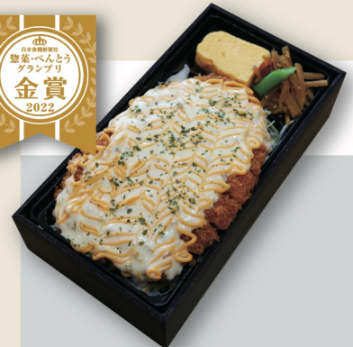
チーズタルタルカツレツ重 ¥1,300 * ご飯大盛りできません