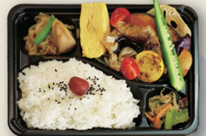
白身魚の黒酢弁当 ¥1,080