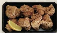
からあげ [8個入] ¥800