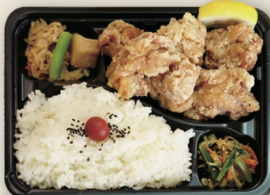
からあげ弁当 (からあげ6個入) ¥910