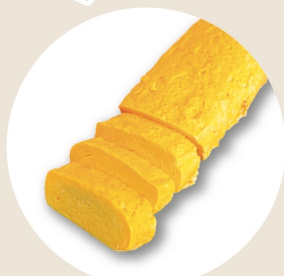
たまご焼き ¥1,100 たまご焼き(ハーフ) ¥600