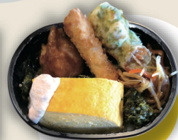
たまご焼きわっぱのり弁 ¥950 * ご飯大盛りできません