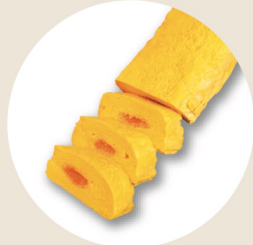
明太子入りたまご焼き ¥1,700 明太子入りたまご焼き(ハーフ) ¥900